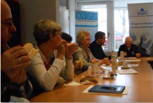
Ook tijdens de lunch werd nog doorgediscussieerd